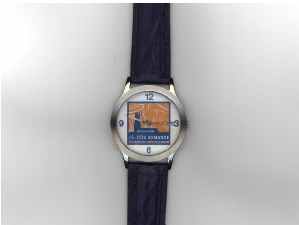
Un superbe cadeau : la montre de la fête romande au prix de Fr. 120.-

1986 – 2006. La Bertholdia a fêté son 20 ième anniversaire. Pour marquer cet événement, le comité a organisé deux prestations de nature différente. La première sortie nous a conduits à Gemenos (France); c'était une façon de remercier les membres, et ce fut une expérience superbe ! Avant de rencontrer les nombreuses sociétés de fifres et tambours de la France, Belgique, et de l'Italie, nous avons pu nous détendre sur les plages de la Ciotat au bord de la mer méditerrané. Cette journée au calme se terminait par un repas en commun au bord de la mer dans une ambiance très chaleureuse. La seconde prestation fut notre concert à Fribourg. Un concert pour vous remercier, chers amis de la Bertholdia, pour votre soutien tout au long de ces 20 années. Vous avez été nombreux à répondre présent, ce qui nous motive à continuer d'exercer notre art, le Fifre et le Tambour.